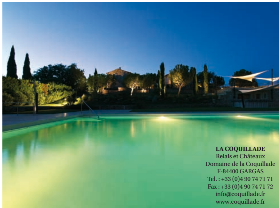
LA COQUILLADE Relais et Châteaux Domaine de la Coquillade F-84400 GARGAS Tel. : +33 (0)4 90 74 71 71 Fax : +33 (0)4 90 74 71 72 info@coquillade.fr www.coquillade.fr