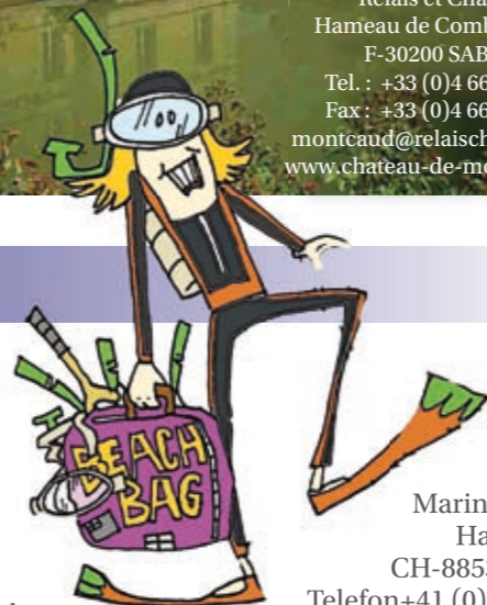
Marina Gastro AG Hafenstrasse 4 CH-8853 Lachen SZ Telefon+41 (0)55 451 73 73 Telefax +41 (0)55 451 73 74 welcome@marinalachen.ch www.marinalachen.ch