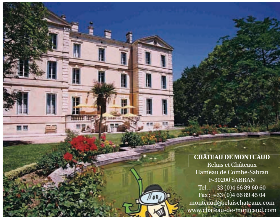
CHÂTEAU DE MONTCAUD Relais et Châteaux Hameau de Combe-Sabran F-30200 SABRAN Tel. : +33 (0)4 66 89 60 60 Fax : +33 (0)4 66 89 45 04 montcaud@relaischateaux.com www.chateau-de-montcaud.com